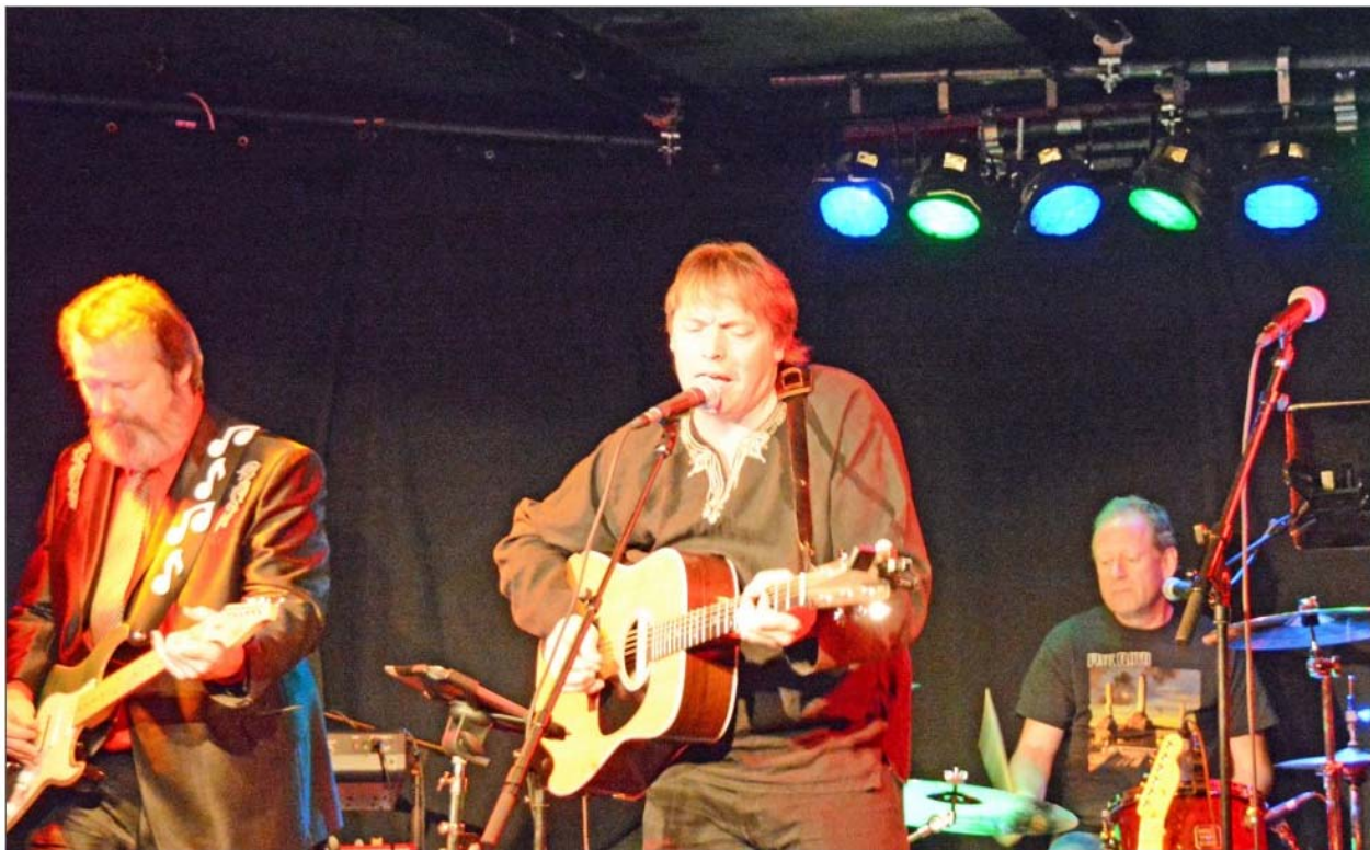
70-TALLSSPESIALISTER: Passengers samlet full pub på Lundetangen skjærtorsdag.